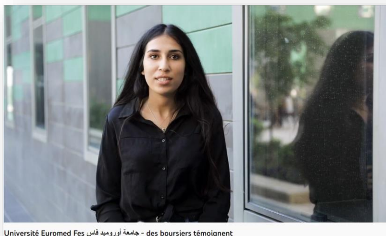
Université Euromed Fes جامعة أروميديد فاس - des boursiers témoignent

https://www.youtube.com/watch?v=iO3R4nQDbhl