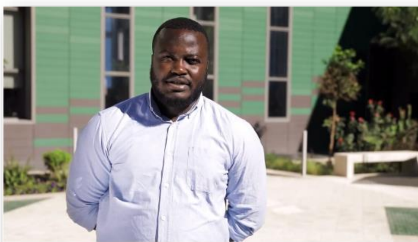
Université Euromed Fes جامعة أروميديد فاس - des boursiers témoignent

https://www.youtube.com/watch?v=6rudesRLZes